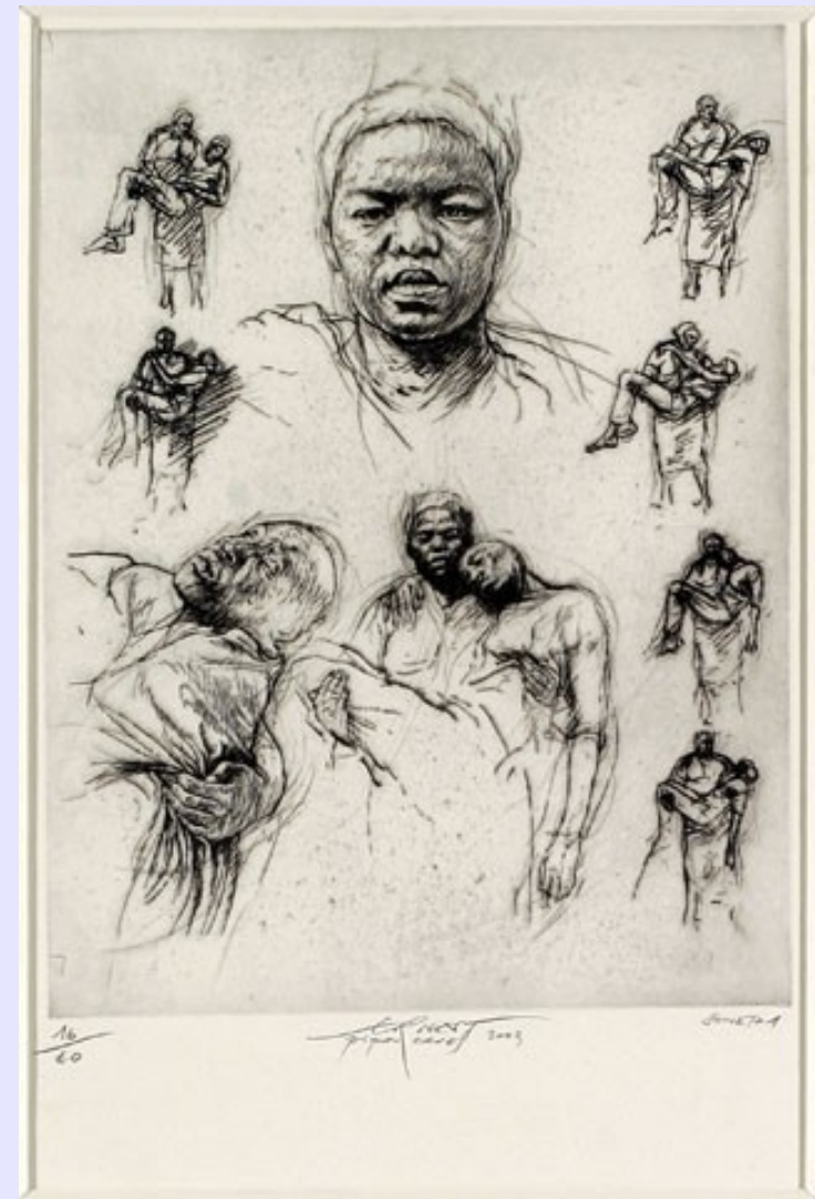
Soweto, 2002, Afrique du Sud