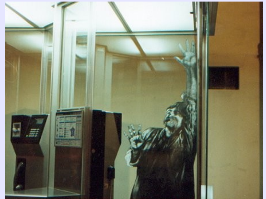
Derrière la vitre, 1996, Lyon