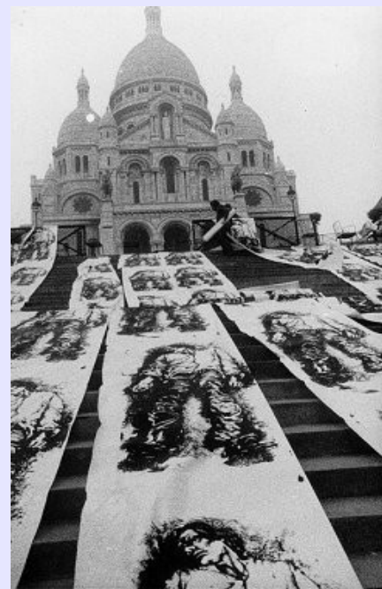
Paris, la Commune, 1971