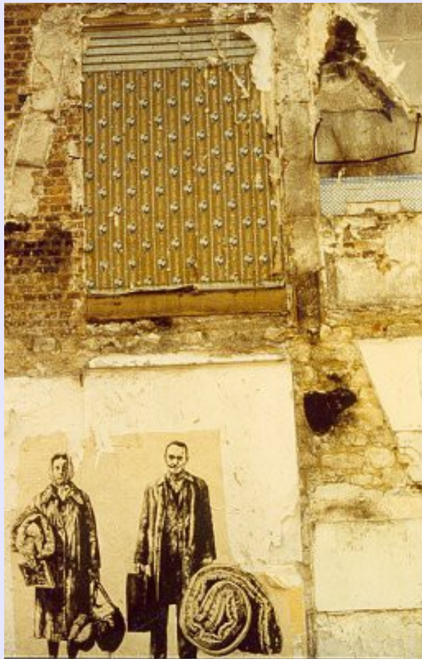
Les expulsés, 1977