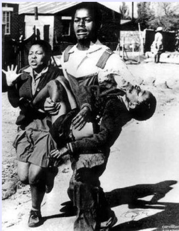
Le 16 juin 1976, Le massacre des enfants de Soweto