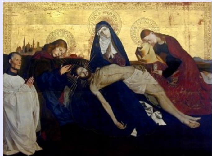
Pietà de Villeneuve-lès-Avignon par Enguerrand Quarton (vers 1455).