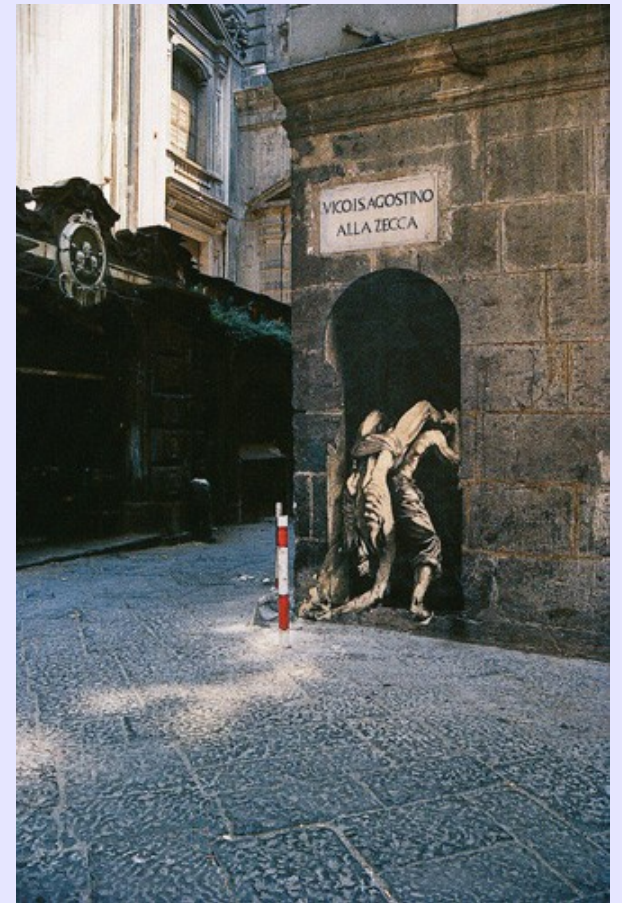
D avid et Goliath d'après Caravage. Dessin à la pierre noire réunissant les têtes tranchées de Caravage et Pasolini, collé vico seminario de nobili en 1988.